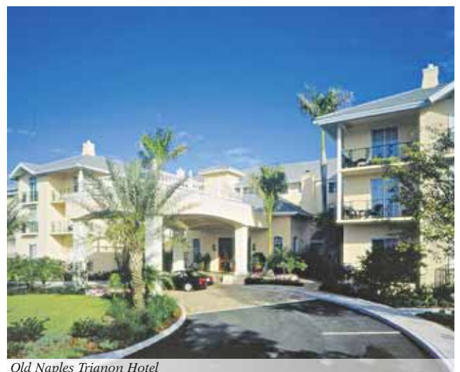
Old Naples Trianon Hotel

Aktuelle Special-Details online & Ihr individuelles Angebot anfordern!