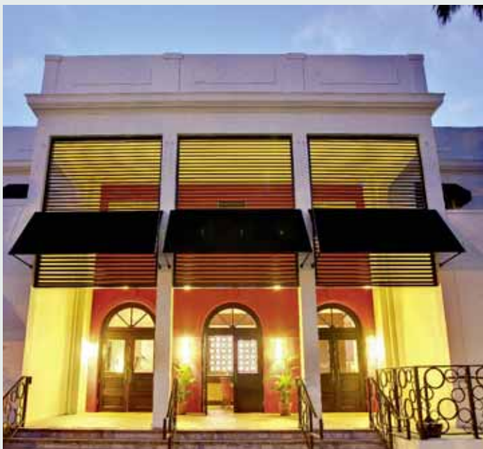
Daddy O Hotel, Miami