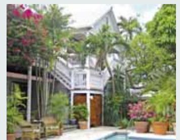
Heron House, Key West