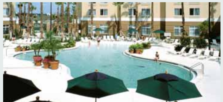
Springhill Suites, Orlando