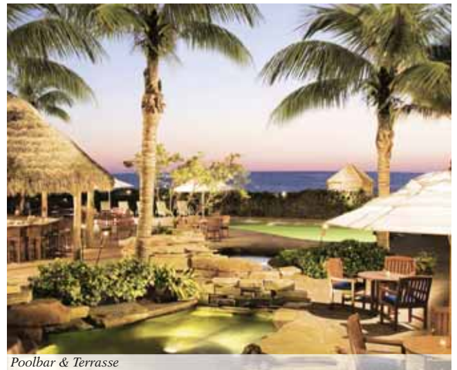
Poolbar & Terrasse

Aktuelle Special-Details online & Ihr individuelles Angebot anfordern!