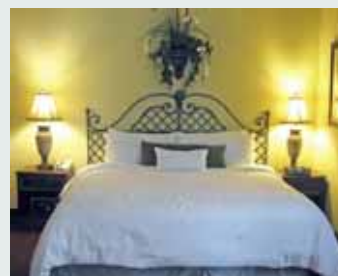
Inn on Fifth, Naples