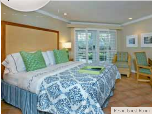
Resort Guest Room

Lage: Direkt am Sandstrand und beim Golfplatz, 5 Fahrminuten ins gemütliche Zentrum von Naples. Zum Flughafen Fort Myers sind es ca. 55 km.