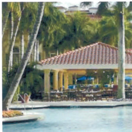
1 Coastal View