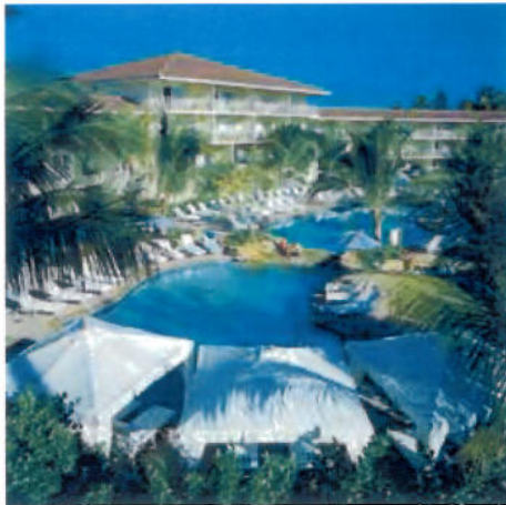
1 Resort View