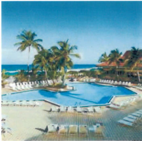
1 Gulf View